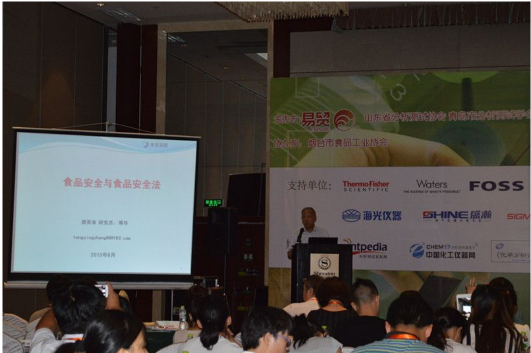
中国检验检疫科学研究院原副院长唐英章作报告