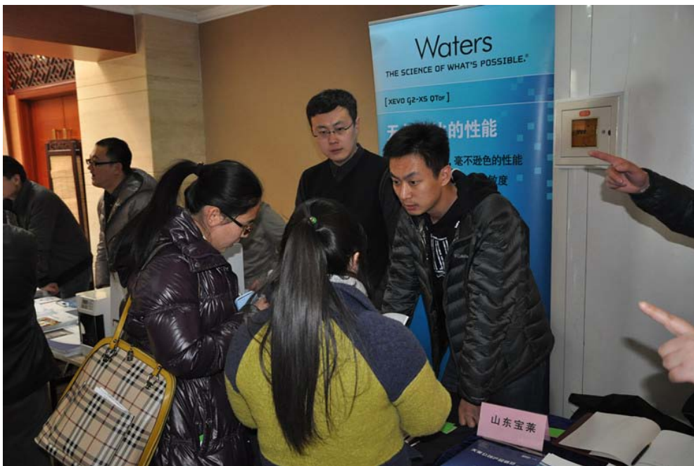
观众参观展台咨询交流