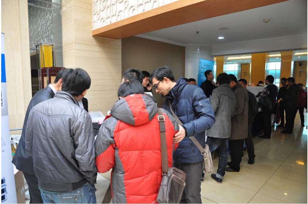
观众参观展台咨询交流