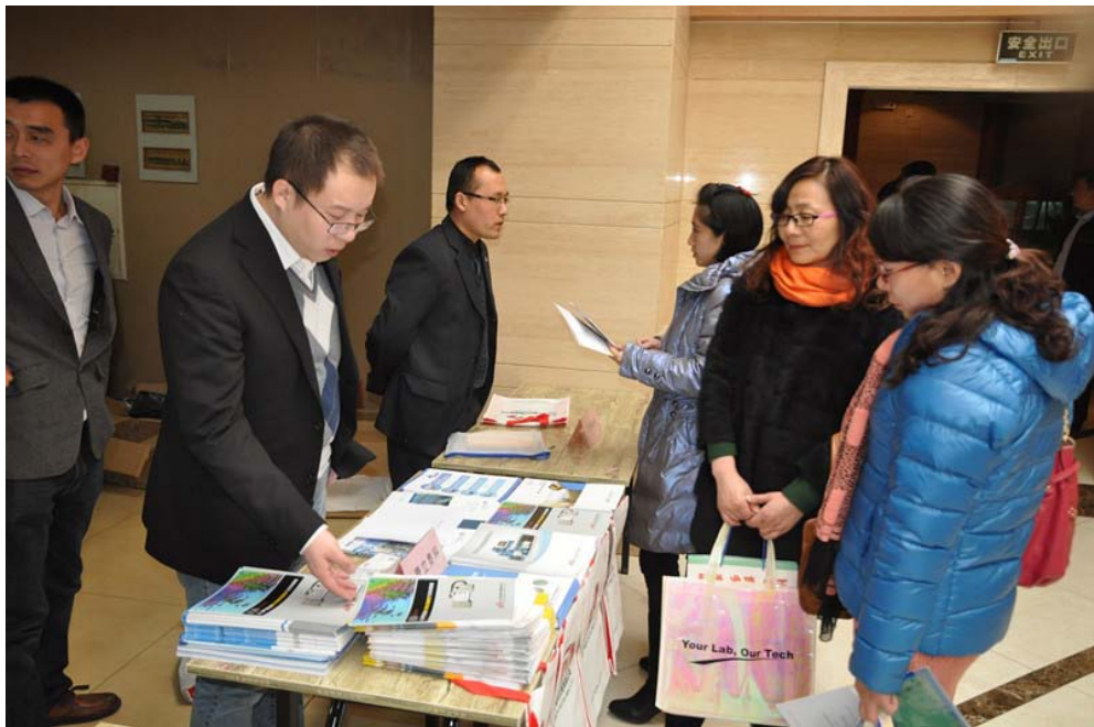
观众参观展台咨询交流