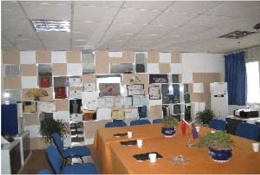
(上图：公司荣誉和成果)