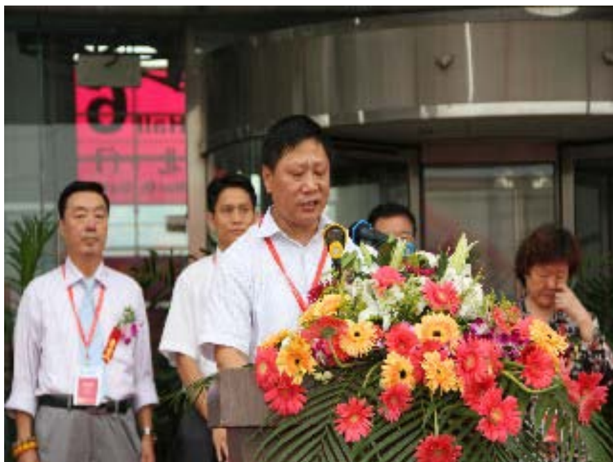
上图：于树良副厅长在开幕式上致辞