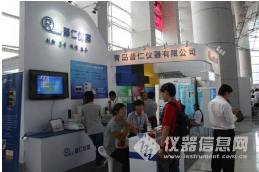
青岛普仁仪器有限公司