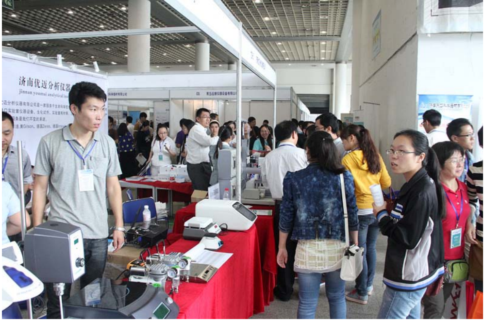
图 9：观众参观现场六