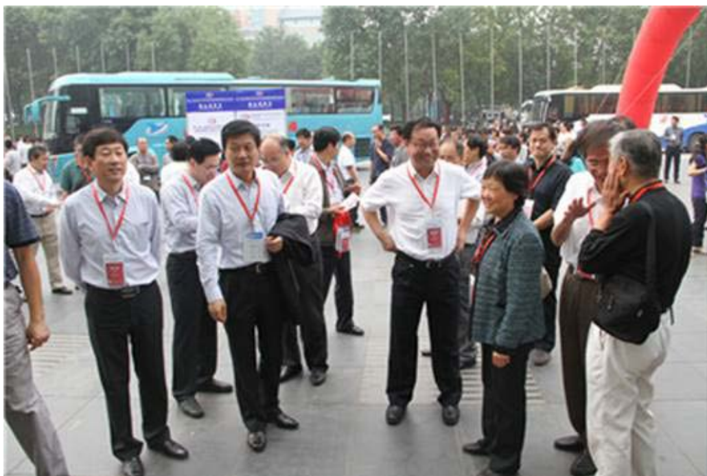
图 1：领导和观众在一起

在各级领导的关心指导下，在会员单位的大力支持下，在全省各地业内人士的积极参与下，大会取得了圆满成功。