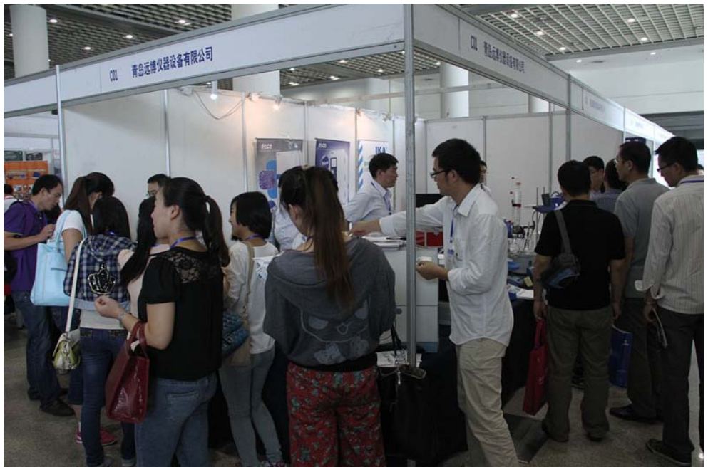
图 5：展览会现场之一