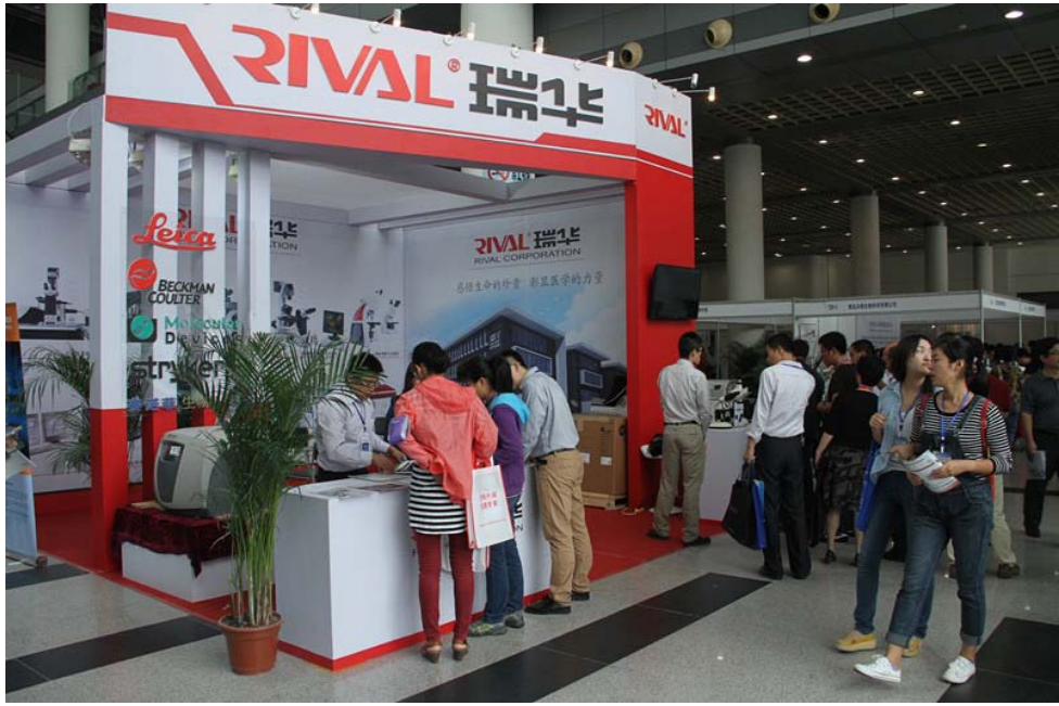
图 6：观众参观现场之二