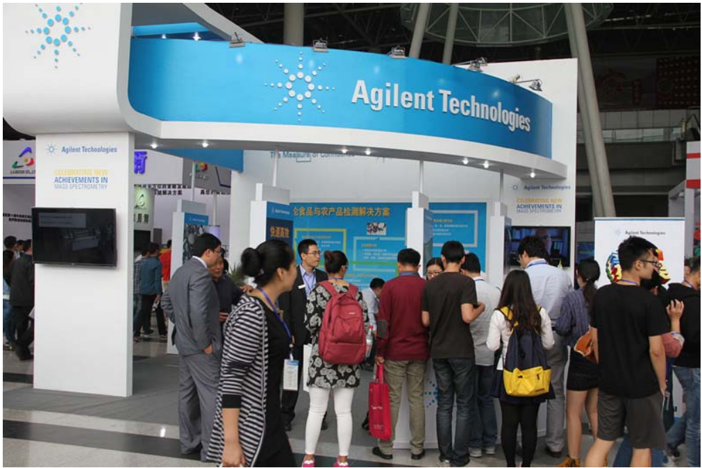
图 7：观众参观现场之四