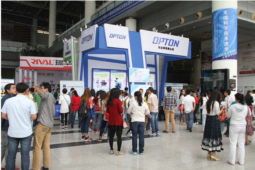
图 7：观众参观现场之三